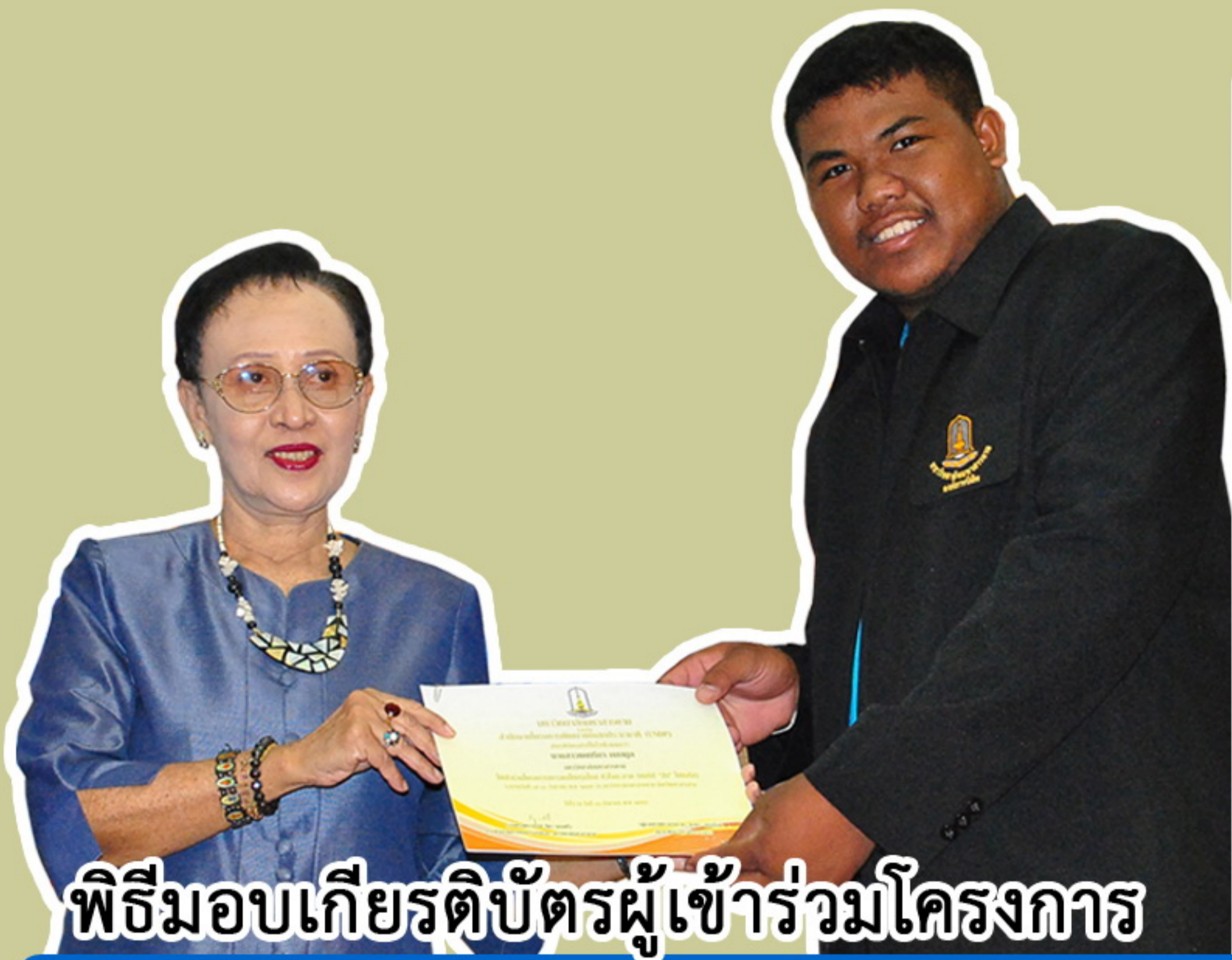
พิธีมอบเกียรติบัตรผู้เข้าร่วมโครงการ