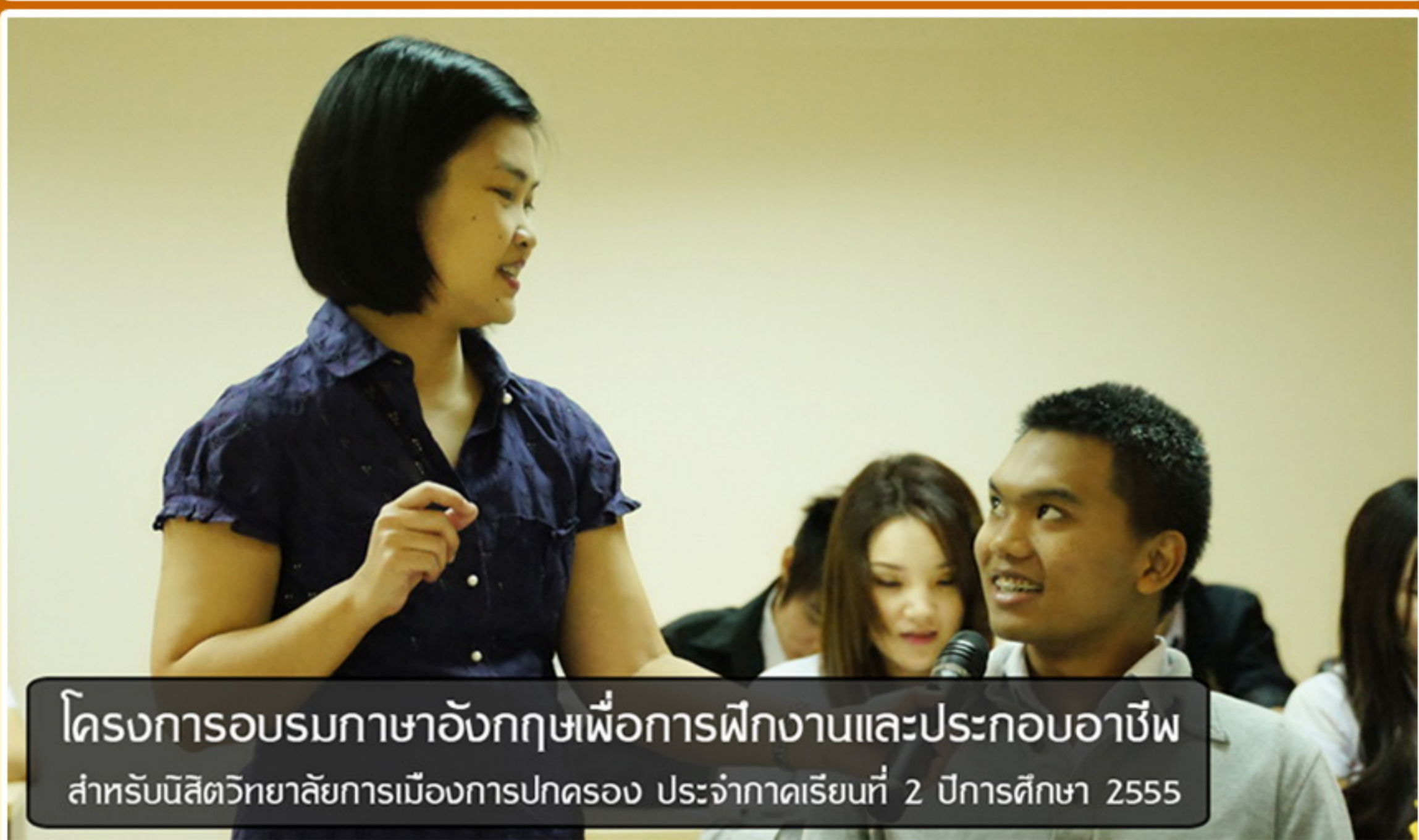
โครงการอบรมภาษาอังกฤษเพื่อการฝึกงานและประกอบอาชีพ สำหรับนิสิตวิทยาลัยการเมืองการปกครอง ประจำภาคเรียนที่ 2 ปีการศึกษา 2555