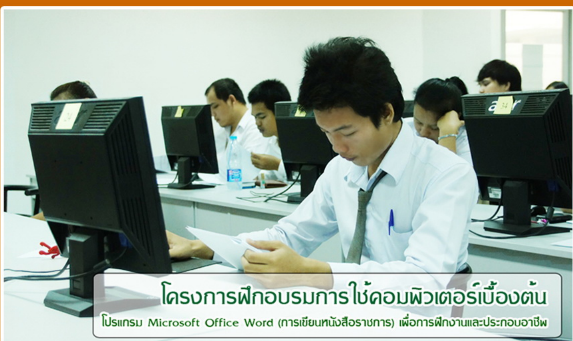
โครงการฝึกอบรมการใช้คอมพิวเตอร์เบื้องต้น ใช้โปรแกรม Microsoft Office Word (การเขียนหนังสือราชการ) เพื่อการฝึกงานและประกอบอาชีพ

ฝ่ายพัฒนานิสิต วิทยาลัยการเมืองการปกครอง ได้จัดโครงการฝึกอบรมการใช้คอมพิวเตอร์เบื้องต้น, โครงการอบรมภาษาอังกฤษเพื่อการฝึกงานและประกอบอาชีพ และโครงการปฐมนิเทศนิสิตฝึกงาน ประจำภาคเรียนที่ 2/2555 ขึ้น ดังนี้